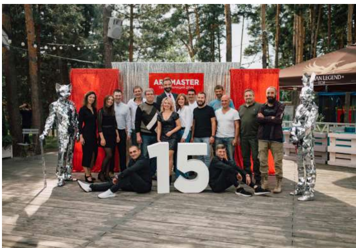
Команда «АРТ МАЙСТЕР» на святкуванні п'ятнадцятиріччя

Відтоді «АРТ МАЙСТЕР» та «Карбон-Сервіс» п'ять років працювали на довірі, не підписуючи жодної угоди.