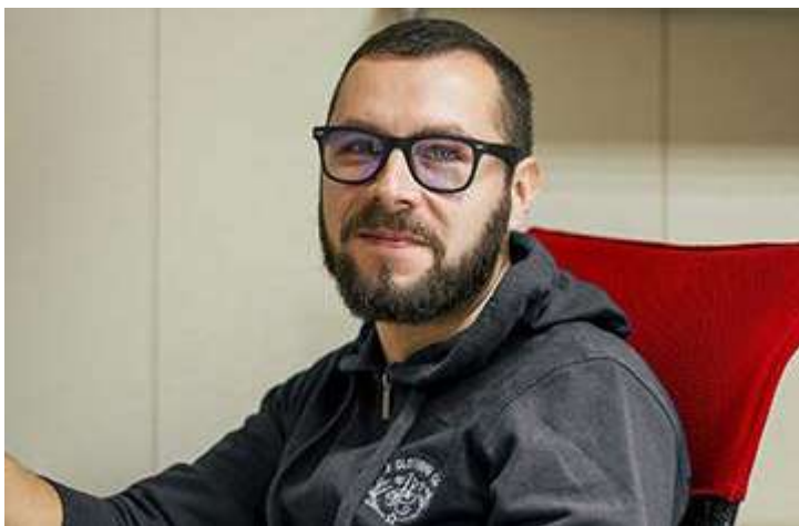
Дизайнер, що працює найдовше