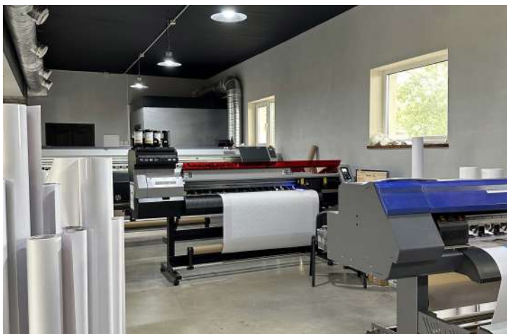
Цех широкоформатного друку Art Master

ринку Житомира, адже обсяг замовлень у місті такий, що подібні інвестиції складно буде окупити, і краще вкласти кошти у додаткове обладнання для постдрукарської обробки.