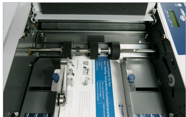
Точне регулювання по згину або паралельному фальцю