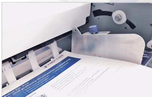
Лоток подачі на 500 аркушів з можливістю підрахунку та призупинення завдання

Ємність станції автоматичної подачі – до 500 аркушів. Лічильник завдань показує кількість оброблених аркушів. Цифровий попередній лічильник (функція зворотного відліку) з інтервальним режимом дозволяє машині зобити невелику перерву після фальцювання фіксованої кількості аркушів, щоб оператор зміг видалити фіксовану кількість документів, не зупиняючи апарат.