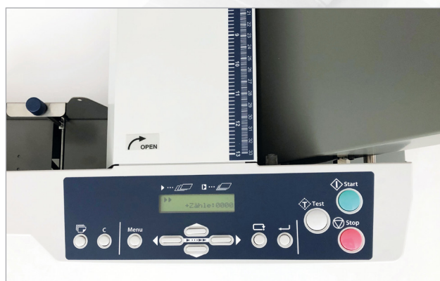
Простий у використанні інтерфейс