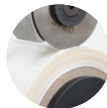
Лезо для перфорації