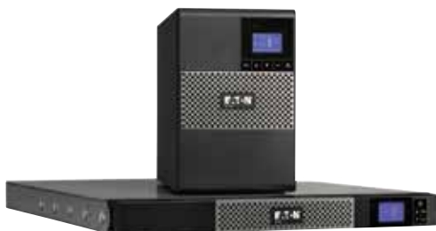
Исполнения Башня и Стойка 1U