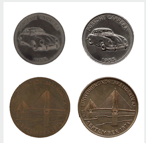
2D сканування у порівнянні з 3D скануванням. Фіксування всіх деталей.