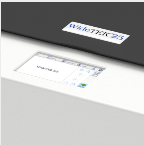
Великий кольоровий сенсорний екран для полегшення використання