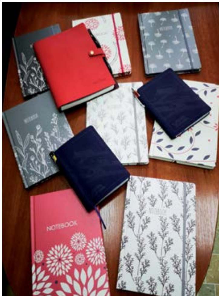
Издательство «Феникс» освоило выпуск эксклюзивных блокнотов и другой канцелярской продукции, которые сегодня успешно продаются через сайт Amazon.com