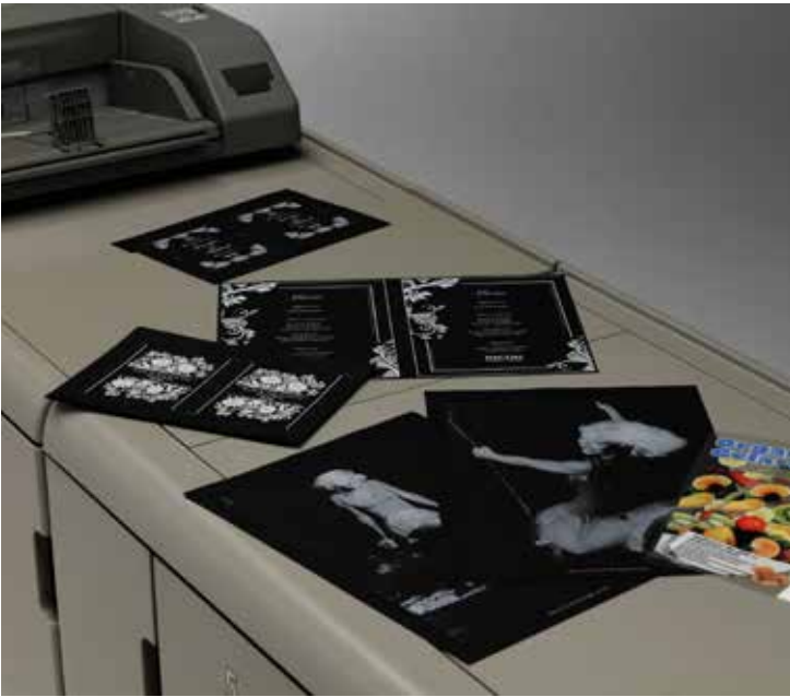
Пример печати Ricoh Pro™ C7100