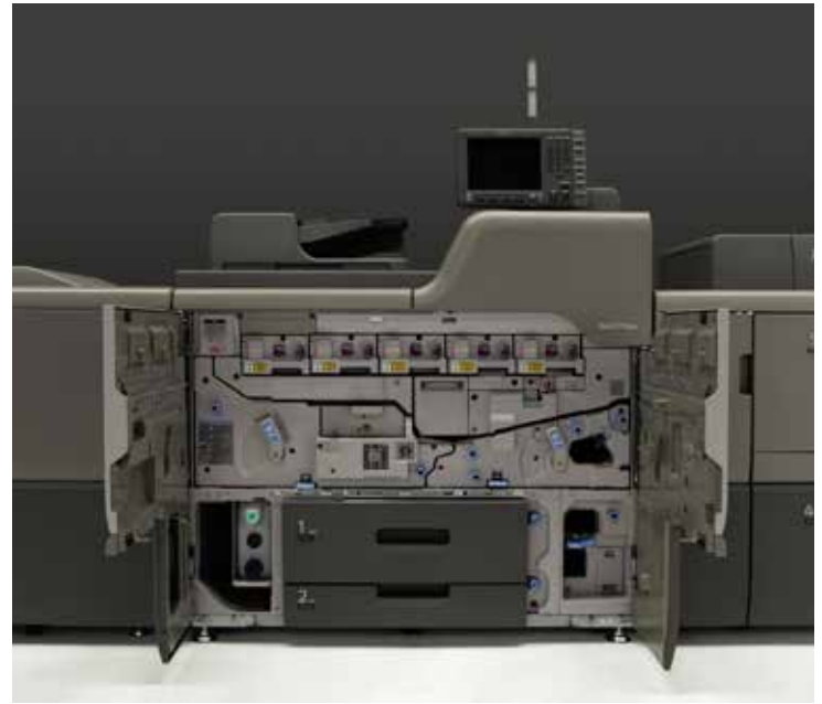
Ricoh Pro™ C7100 (внутренний вид)