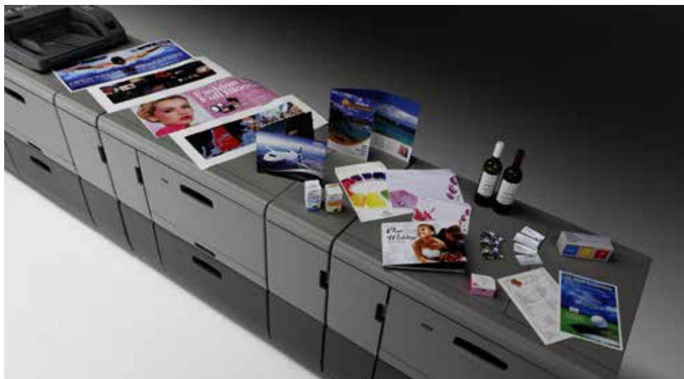
Ricoh Pro™ C9100

Достаточно новым сегментом для Ricoh являются рулонные машины VC60000, целый ряд которых инсталлирован в Европе и Америке. Владислав говорит, что в Украине есть один потенциальный проект, связанный с возможностью инсталляции такой машин, и сегодня анализируется возможность поставки такого оборудования. В данном случае речь идет о достаточно больших инвестициях, и потому необходимо взвешенно подходить к вопросу покупки.