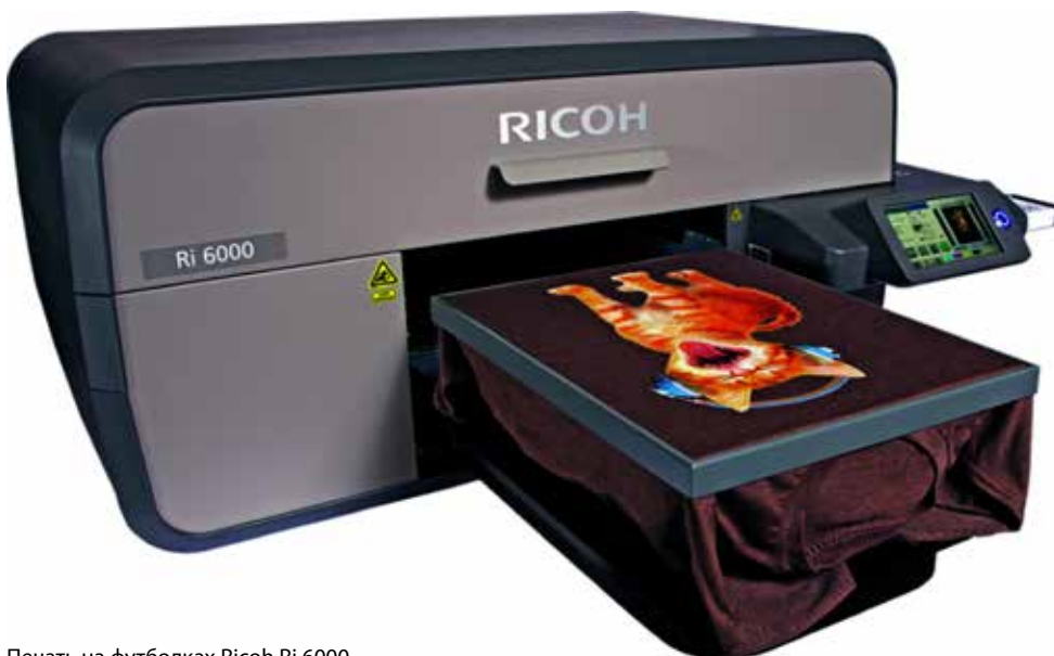
Печать на футболках Ricoh Ri 6000

«Наша компания предлагает ряд популярных на рынке финансовых инструментов, призванных облегчить покупку машин для клиентов. Мы понимаем, что на нашем достаточно сложном рынке непросто найти сумму свыше €50 тыс, и поэтому вендор и компания «Мегатрейд» разработали совместное пакетное предложение, рассчитанное на компании, активно работающие на рынке», – замечает Владислав Швецов в конце нашей беседы.