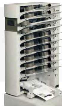
AC 510 with air separation

Зручні високопродуктивні листопідбірні машини Morgana серії C510 для роботи з цифровими і офсетними відбитками.