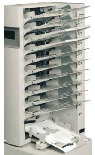
C510 без повітряного роздуву