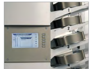
ACF510: дисплей і вентилятори роздуву